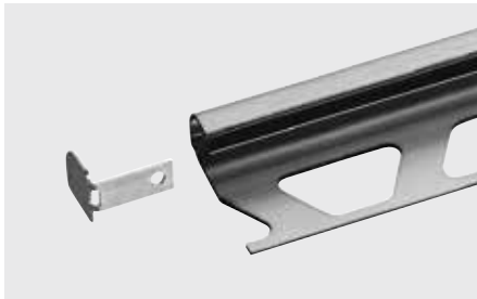
Schlüter®-RONDEC-EB/EK (eindkapje roestvast staal geborsteld voor RONDEC-E en -EB)