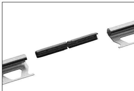
Schlüter®-RONDEC-A/V (verbindingstuk voor aluminium profielen)