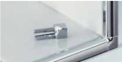
Schlüter®-RONDEC binnen- en buitenhoeken