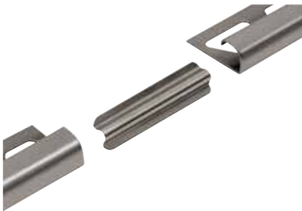
Schlüter®-RONDEC-E/V (verbindingsstuk voor roestvaststalen profielen)